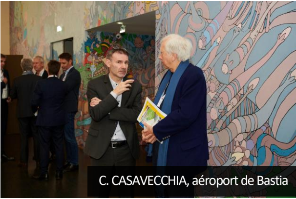
C. CASAVECCHIA, aéroport de Bastia