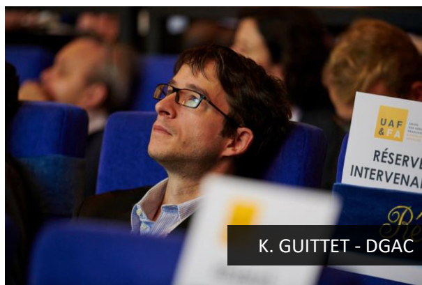
K. GUITTET - DGAC