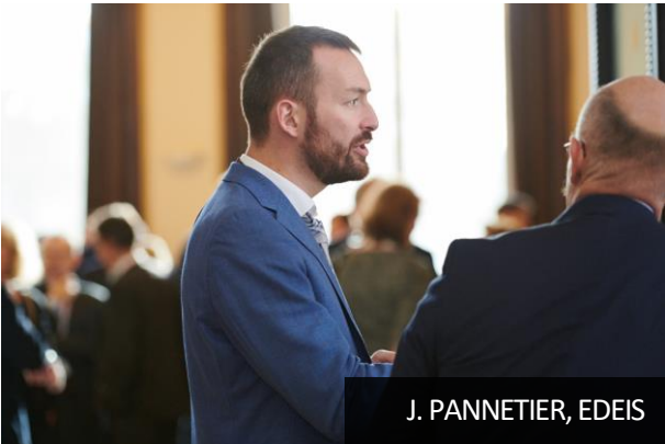
J. PANNETIER, EDEIS