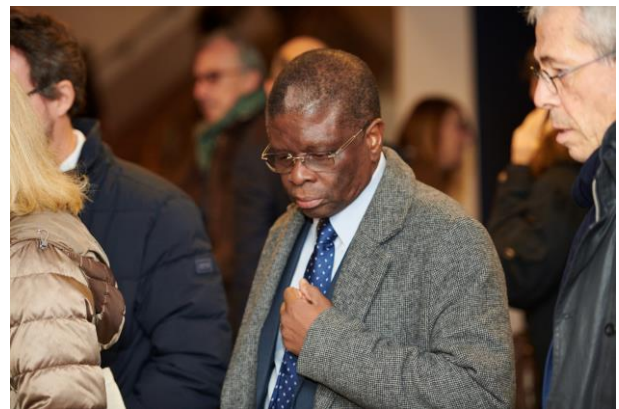
Les aéroports d'Agen, Marseille, Brest, l'UGAACO, entre autres participants au Congrès, attendent leurs badges