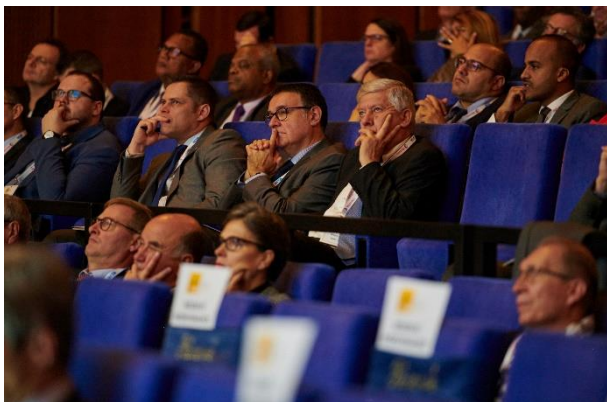
Plus de 310 personnes présentes et attentives à l'Assemblée plénière.