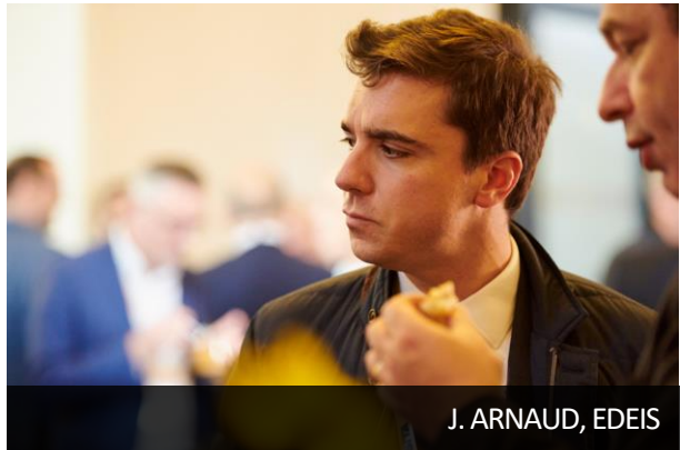
J. ARNAUD, EDEIS