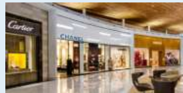
Best Airport Shopping (5 ème )