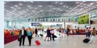
S4 : Best Airport Terminal (6 ème )