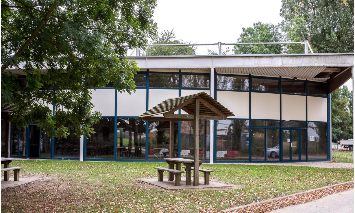
Figure 1 Photo bâtiment A09 – Vue extérieure