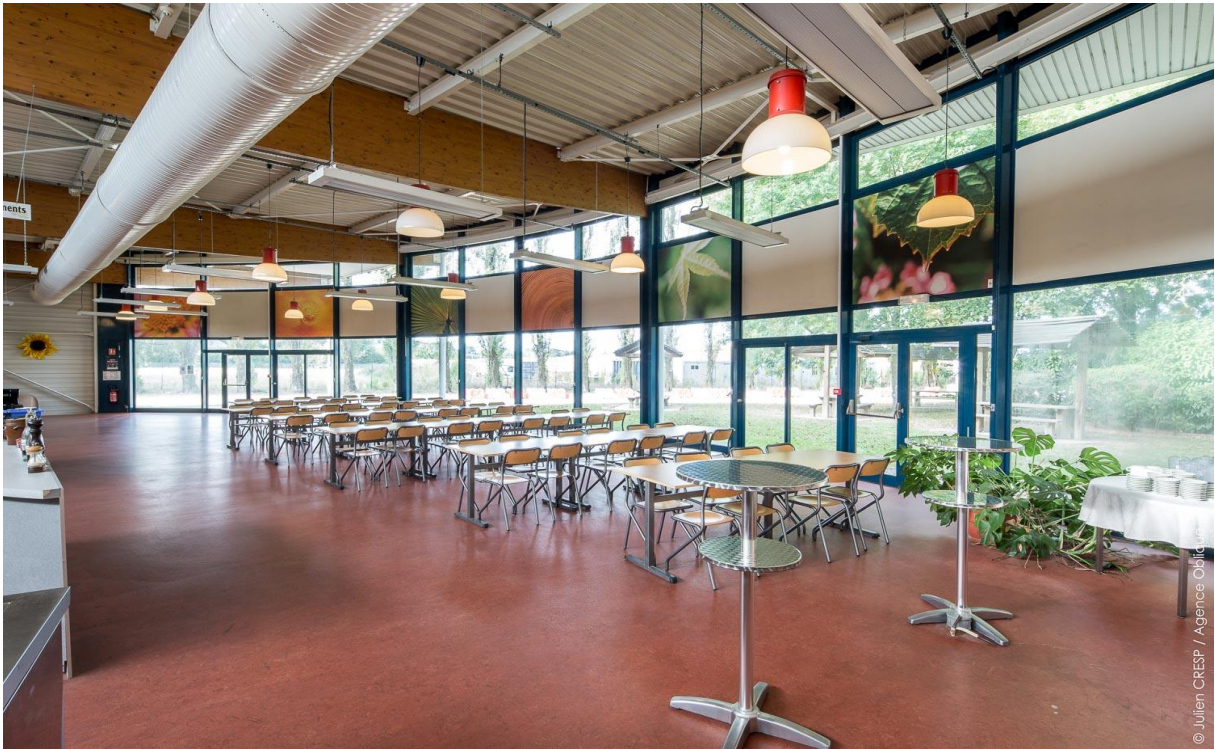
Figure 2 Vue intérieure salle de restaurant